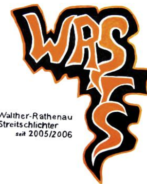
Walther-Rathenau Streitschlichter seit 2005/2006